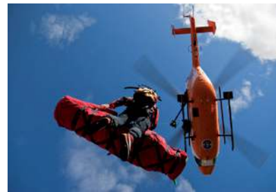
© Spidit 981 | Folie #21231830

Die finanziellen Folgen einer körperlichen Schädigung durch einen Unfall. Ein Unfall liegt vor, wenn die versicherte Person durch ein plötzlich von außen auf den Körper wirkendes Ereignis (Unfallereignis) unfreiwillig eine Gesundheitsschädigung erleidet.